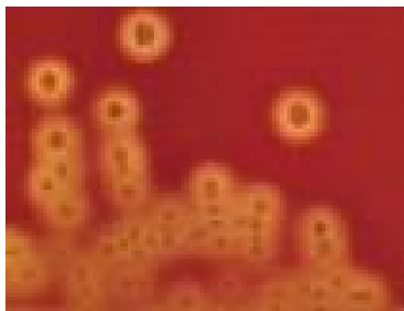
Slika br.1. β hemoliza

Na podlogama sa krvi izazivaju razgradnju eritrocita što se vidi kao prozirni deo oko kolonije (potpuna hemoliza ili β hemoliza), dovode samo do promene hemoglobina što menja boju podloge u zelenu (nepotpuna ili α hemoliza) ili uopšte nemaju delovanje na krvnu podlogu (non hemoliza ili γ hemoliza)